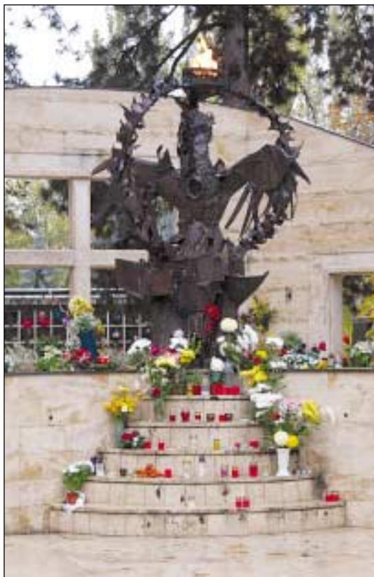
Kegyeleti hely a Rákoskeresztúri Köztemetőben

A hajdani rómaiak őseiket és hőseiket istenként és félistenként tisztelték, szobrot emeltek, szentélyt állítottak számukra. Marcus Agrippa i.e. 27-ben építtette