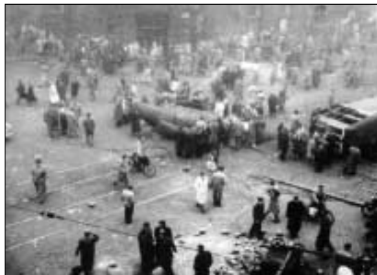
Sztálin szobra a Blaha Lujza téren