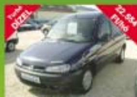
Peugeot Partner 2.0 HDi , szervokormány, vezérlung, klímaber, rádió, kőp. sz. stb. Ár: 1.041.000,- Ft + Áfa Tel.: +36(30)99-8987

Ízelítő 370 db-os használtautó készletünkől Részlet 10%-tól!