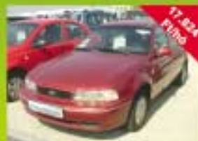
Daeon Naxos 1.8 , szervokormány, klímaber, rádió, magnó, mobiltelefon, stb. Ár: 550.000,- Ft Tel.: +36(30)717-7206