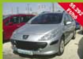
Peugeot 307 Break 1.8 A&S , szervokormány, klímaber, CD+rádió, automatika klímaber, kőp. sz. stb. Ár: 3.158.000,- Ft Tel.: +36(30)243-8976