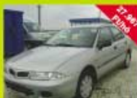
Mitsubishi Carisma 1.4 , szervokormány, klímaber, kőp. sz. stb. Ár: 1.530.000,- Ft Tel.: +36(30)256-6861

Használt gépjárművét beszámítjuk, akár hitelátvállalással is! Online értékbecslés: www.fredibeni.hu