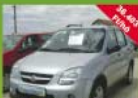
Suzuki Ignis 1.5 A&S , vezető és utasszéki légzsák, szervokormány, klímaber, CD+rádió, kőp. sz. stb. Ár: 1.758.000,- Ft Tel.: +36(30)256-6861