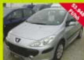
Peugeot 307 1.4 A&S , szervokormány, klímaber, rádió, magnó, CD+rádió, automatika klímaber, kőp. sz. stb. Ár: 2.890.000,- Ft Tel.: +36(30)256-6861