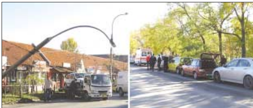
A színes házaknál a lámpaoszlop is kidőlt. A Pesti út 360. előtt négy autó ütközött

Télen a balesetveszély nagyobb, mint nyáron, ezért legyen autónkban mindig hólapát, hólánc, jégoldó spray és meleg kesztyű. A legtöbb autós mégsem mérlegel reálisan, holott egy kisebb koccanás is százazrekbe kerülhet. Talán épp emiatt október végén és november elején a kerületben is elsziporodtak a koccanásos balesetek.