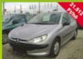
Peugeot 206 1.8 , szervokormány, klímaber, rádió, magnó, mobiltelefon, stb. Ár: 1.180.000,- Ft Tel.: +36(30)256-6861