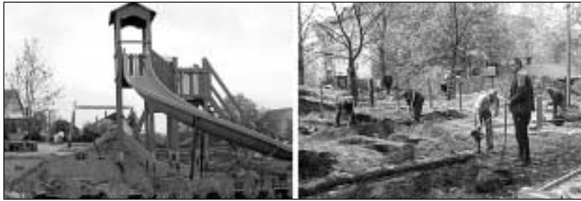
A Vida-dombi játszótér majdnem kész, de az Újlak utcában is gőzerővel dolgoznak

A Vida-dombi játszótér építéséről 2006. novemberében hozott határozatot a képviselő-testület. Itt 13 millió forintot adott az önkormányzat, és 8 milliós támogatást nyertek a fővárostól. Európai színvonalú, új játszóeszközöket szerelnek fel, alattuk gumitéglákkal, az összekötő utakon térkőburkolatot raknak le, és a pihenni vágyók számára padokat állítanak. A játszóterek teljesen körbe lesznek kerítve. A Vida-dombi játszó-