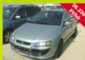
Mitsubishi Space Star 1.3 A&S , szervokormány, klímaber, CD+rádió, mobiltelefon, stb. Ár: 2.058.000,- Ft Tel.: +36(30)274-1298