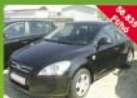
Kia Cee'd 1.6 A&S , vezető- és utasszéki légzsák, szervokormány, klímaber, CD+rádió, kőp. sz. stb. Ár: 1.168.000,- Ft Tel.: +36(30)251-5416