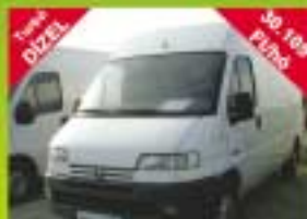
Peugeot Boxer 2.5 Turbo Diesel , szervokormány, klímaber, kőp. sz. stb. Ár: 1.400.000,- Ft + Áfa Tel.: +36(30)256-6861