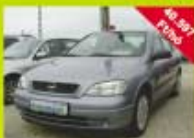
Opel Astra 1.4 A&S , szervokormány, klímaber, CD+rádió, mobiltelefon, stb. Ár: 2.258.000,- Ft Tel.: +36(30)717-7206