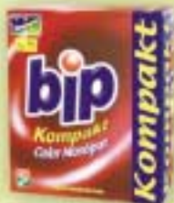
Bip Kompakt Color, 2 kg