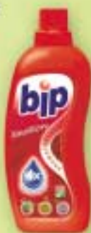
Bip Emotion 750 ml