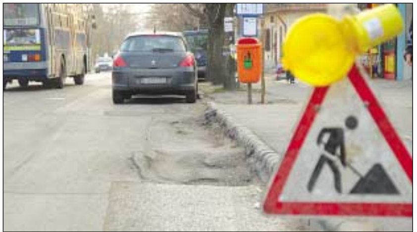
A Ferihegyi úton a buszok jelentik a legnagyobb próbatételt az aszfalt számára

2009–2010-ben a következő főutak felújítására kerül sor: Baross utca, Bélatelepi út, Keresztúri út kerületi szakasza, Lázár deák utca, Rákoskert sugárút, Tarcsai út, Czeglédi Mihály utca, Csabagyöngye utca, Diadal út, Helikopter út, Lemberg utca, Naplás út.