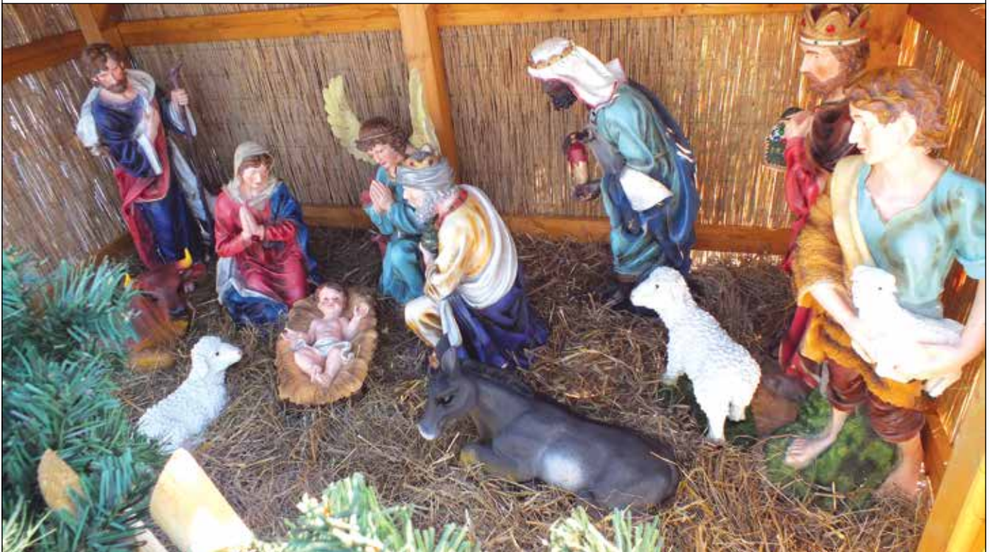
A Fő téren felállított Betlehem