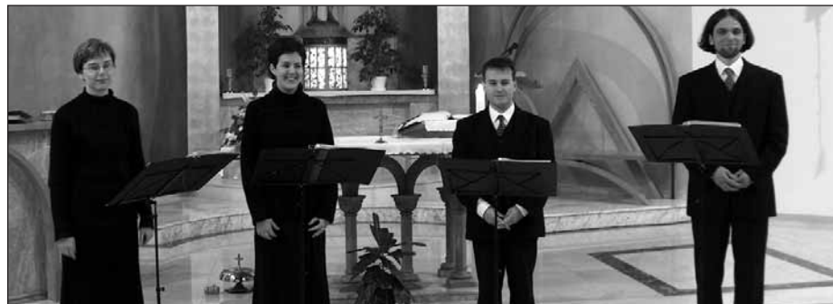
A Vox Nova Énekegyüttes adott nagy sikerű koncertet a Szent Pál templomban és a Madárdombon.

A repertoár a kóruséneklés számos korszakát és műfaját öleli fel, de többésgben vannak a reneszánsz és a XX. századi kórusművek. Az énekegyüttes templomi koncertek mellett fellépéseket vállal világi rendezvényeken, és külön-