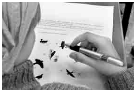
Különböző fejtörőkkel, programokkal várták a diákokat

Vajon mekkora a réstias szárnyának feszítvája? Hogyan viszonyulnak egymáshoz az erdei állatok testmásgasságai? Hogyan dolgozzák fel a háztartásokban keletkező hulladékokat? Hogyan köt össze különféle kultúrákat a Duna-mellék, mint folyami élőhely? Hogyan formálja a víz a különféle földrajzi formákat? Ilyen és ehhez hasonló kérdésekre kerestek válaszokat a Diadal Úti Általános Iskola diákjai április végi Zöldnapjukon. A kicsik és nagyok számára forgószínpadszerűen összeállított programban kézművességgnek is szorítottak helyet a diákönkormányzat tagjai: madárfigurák születtek termésekből, hajtogatásból és üvegfestésből. Természetesen a komo-