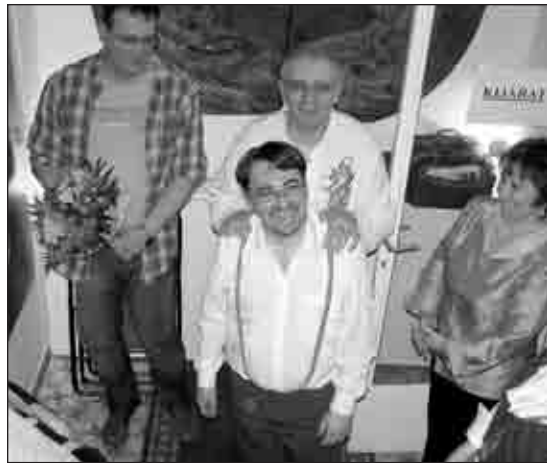
A társulat Csetényi Anikó és Ferch Ottó emlékének ajánlotta az előadást, s virágot helyeztek el az emlékfalnál

A színmű első bemutatójára még 1970-ben Várkonyi Zoltán rendezésében került sor Páger Antallal és Bulla Elmával a főbb szerepekben. A darab hősei a hetvenes évek tipikus családját formázzák meg, de nem kell ahhoz nagy merészség, hogy kijelentsük, 2008-ban