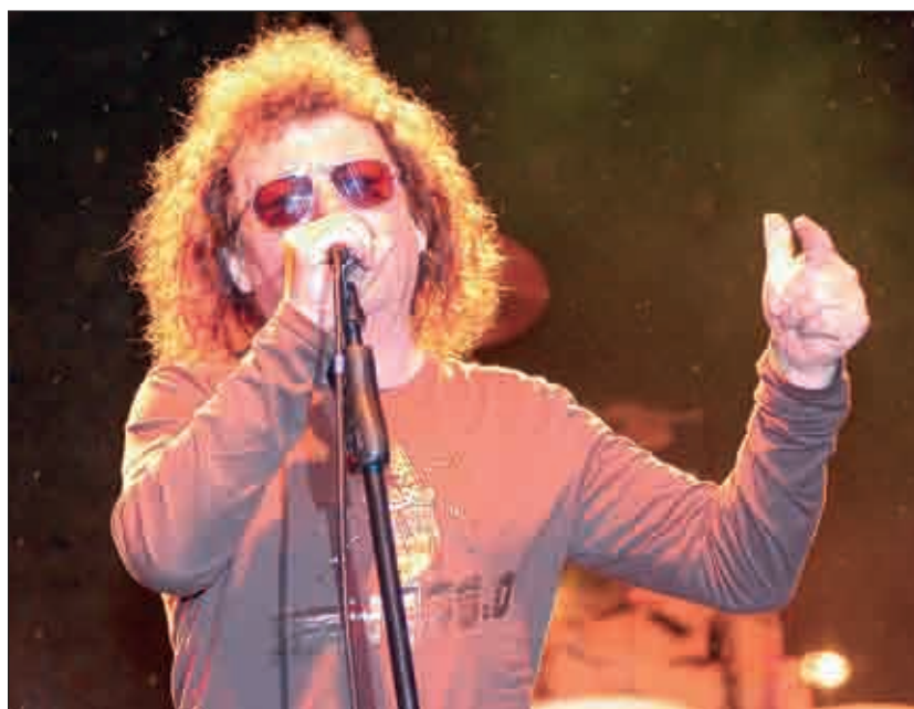
Közel tízezen voltak Demjén Ferenc koncertjén