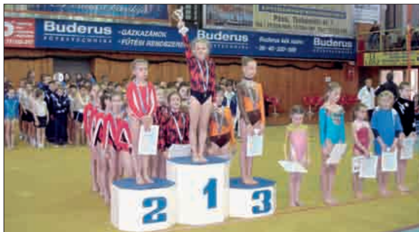
A rákoskerti Kossuth iskola lányai a dobogó legfelső fokára állhattak fel

Történelmi és sporttörténelmi esemény ez az iskola és a XVII. kerület életében is. A kossuthos tornászok más tekintetben is egyedülállók. Nincs az országban