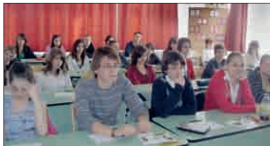
Háromszázan versenyeztek nyelvÉSZ-etből