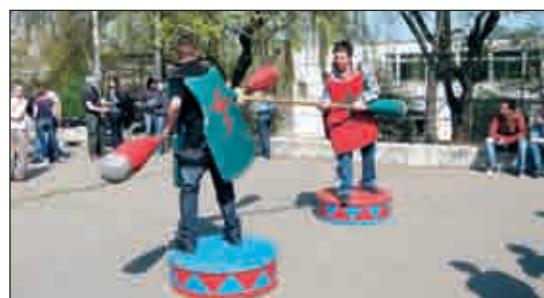
Érdekes programok várták a diákokat a Csoma-héten

A Kenguru Nemzetközi Versenyen és a Bátaszéki Matematika Versenyen is az élen végeztek.