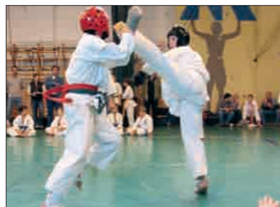
Közel száz versenyző csapott össze a versenyen