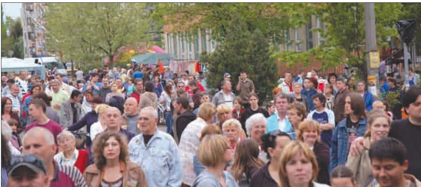
Tízezres tömeg a kerület főutcáján