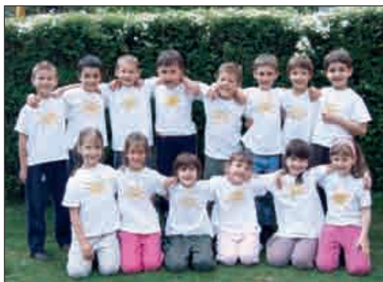
A győztes napsugáros Maci csoport ovisai

A prilis 23-án rendezték meg a Jókai általános iskola szervezésében az óvodások Nyúlciptő futóversenyét. A középső csoportos lányoknál a Hétszínvirág Óvoda lett az első, a Napsugár Ózike csoportja a 2. és a Piroksa Óvoda a 3. A középső csoportos fiúk-nál a Hófehérke Óvoda