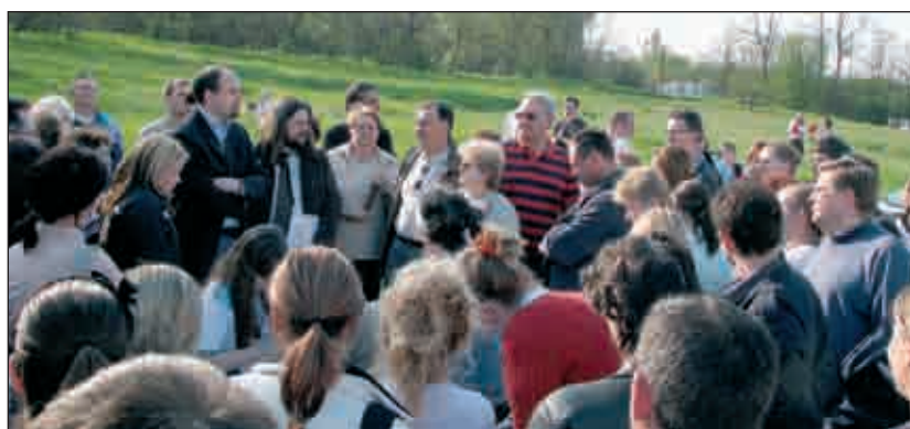
Közösségi tér a szabad ég alatt