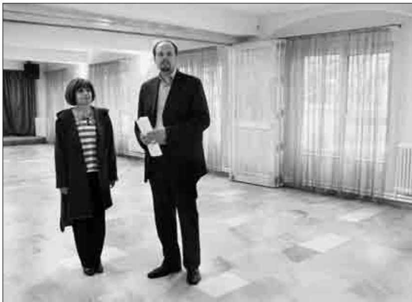
A terem nyílászáróit kicserélték, új állmennyezet készült korszerű világítással

A Fórum-terem átadásán Riz Levente polgármester elmondta, kis lépésekben tovább folytatódik a ház fejlesztése. A testület döntése értelmében szeptember 6-tól az intézmény új neve Vigyázó Sándor Művelődési Ház lesz. A névadó ünnepségre szeretnék rendbehozni a homlokzatot, a ház körüli közvilágítást, valamint további parkolóhelyek kialakítására is szükség van. Az önkormányzat középtávú tervei között szerepel egy szabadtéri színpad kialakítása a Dózsa mö-