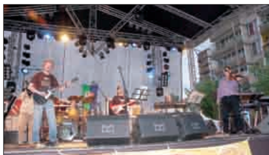
Riz Leventéék rockzenét játszottak

Folytatás az 1. oldalról > Őket követték a rákosszentmihályi iskolák művészeti csoportjainak bemutatói, amelyek során ízelítőt kaphattunk autentikus néptáncból és híres musicalrészletekből egyaránt (Hair, Grease, Padlás). Minden iskola tízperces fellépési időt kapott, a gyerkőcöket szép számú szülő kísérte el. 11.30-kor hamisítatlan dél-amerikai hangulat hevítette a közönséget egy Capoeira-bemutató során, a fellépők tán-