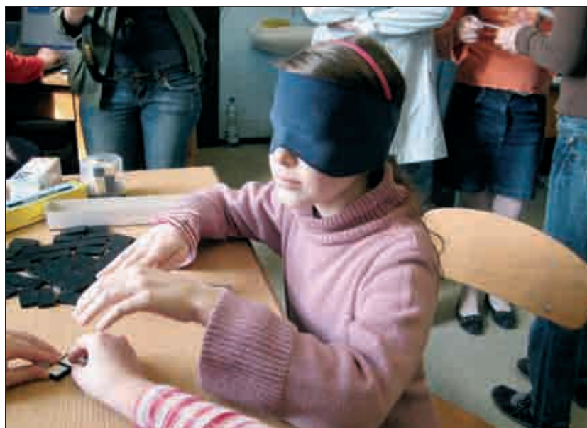
A látogatók számos vakokat segítő eszközzel megismerkedhettek

A kiállítás „apropóját” az az önkormányzati döntés adta, amelynek értelmében a jövő tanévtől kezdődően az önkormányzat saját intézményei útján kívánja biztosítani a kerületben élő, integráltan nevelhető, oktatható sajátos nevelési igényű gyermekek ellátását. A programmal a vakok és a látók világát igyekeznek közelíteni egymáshoz, látó embereket hoznak olyan helyzetekbe, amelyek mentén megtapasztalhatják a mindennapi élet vakokkal szemben támasztott követelményeit, nehézségeit. A látogatók megismerkedhetnek a vakokat segítő eszközökkel is, mint például a beszélő számítógép, a braille-írógép, illetve dombortérképek. A megnyitó előtti sajtótájékoztatókon megjelent Riz Levente polgármes-