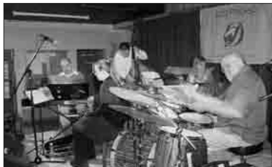
Nemzetközi hírvűvészek a Jazz Pressó színpadán

A „vissza az időben” tett utazás során kiderült, hogy a reneszánsz is egyfajta visszatérés volt a szépségkultusz, a boldogság, emberközpontúság, a képzőmű-