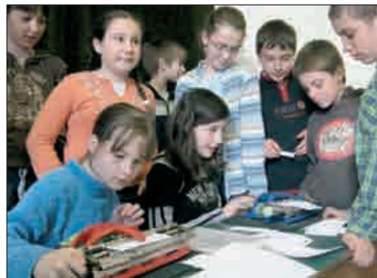
Árny alatt. Rendhagyó kiállítás nyílt a vakok életéről a Gregor József Általános Iskola VIII. utcai épületében április 15-én.