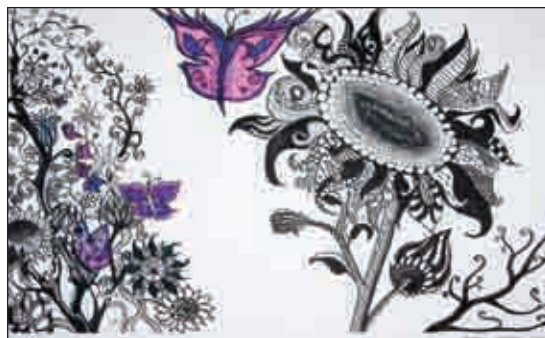
A diákok rajzaiból nyílt kiállítás a Dózsában

„Ez a kiállítás a vizuális kultúra értékeit hivatott közvetíteni.” A kiállított gyermekrajzokon jó pár népmesei motívum volt látható. „A népmesék nem csupán a tudást, hanem a hozzárendelt lelki élményt és erkölcsi tanítást is közvetítik, illetve generációról generációra hagyományozzák” – tette hozzá a rendezvény védnöke. Az alpolgármester