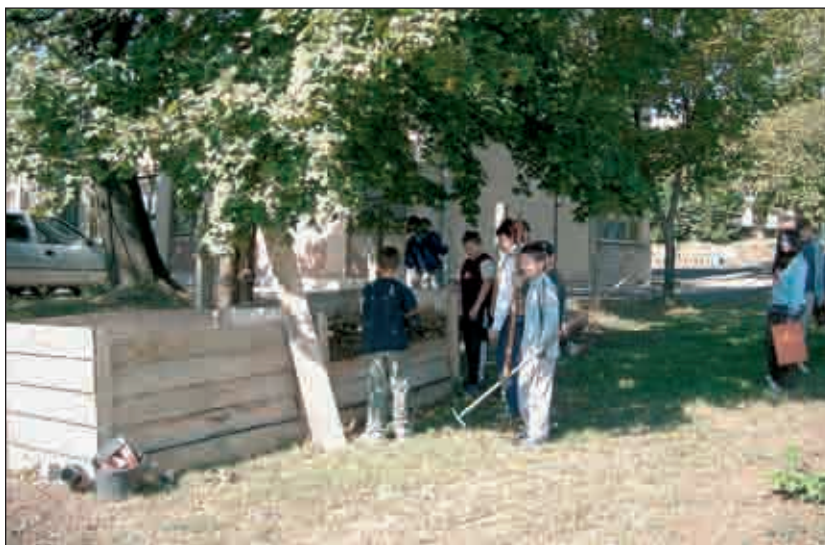
A kerületben sokan érzik úgy, hogy tenni kell Földünk megmentéséért

A fővárosban az FKF Zrt. tájékoztatása szerint évente 600 000 tonna hulladék kerül elszállításra. A statisztikai adatok szerint egy ember 300 kg-nál több hulladékot termel évente. Ennek egy harmada, (100 kg) a zöld hulladék. Kerületünkben ha csak 80 000 lakossal számolunk ez az érték 8000 tonna. Ha betartottuk volna a Hgtv. előírását