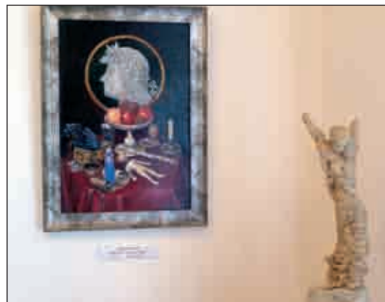
A művek századunk nosztalgikus reneszánsz jegyeit idézik