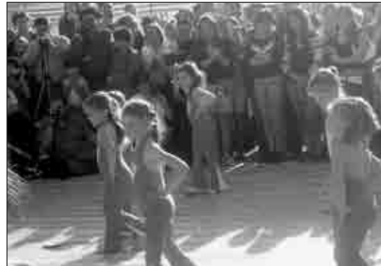
A Cassandra Táncstúdió látványos műsora nagy siker volt