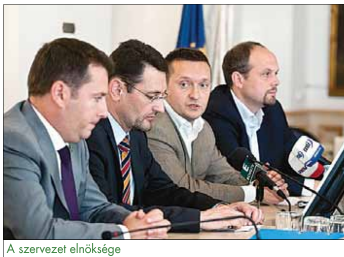
A szervezet elnöksége

A szervezet olyan kérdésekben kíván közös álláspontot kialakítani, mint a közoktatási törvény, az egészségügyet érintő jogszabályok vagy az önkormányzati törvény. Emellett a BÖSZ célja az is, hogy ki-