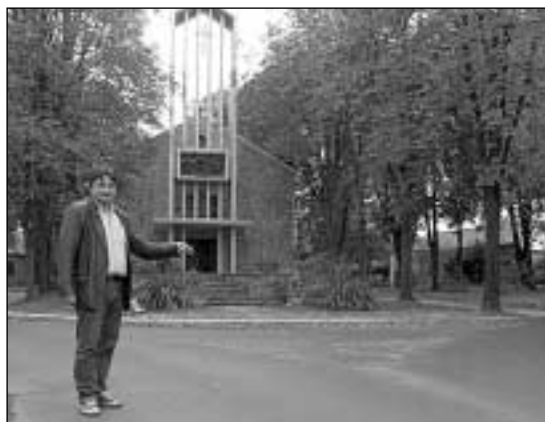
Régi adósság volt, végre felújították a Szabadság sugárutat is

– Kerületünket márdartávlatból nézve, elsősorban lenyűgöző méretei és településrészeinek sokszínűsége jellemzi. Előttünk vannak még a csatornázatlan földutak, a csapadékvíz-elvezetés megoldásra váró feladatai. Ezek a lakosságot leginkább érintő közfeladatok éppúgy részei mindennapjainknak, mint az örömmel fogadott, megépített új, illetve felújított utjaink.