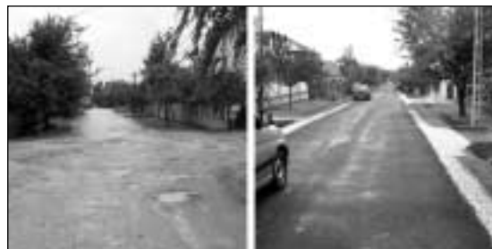
Az előző ciklus idejében történt, permetezett zúzóköves, rendkívül hiányos útjavítás, és a megfelelően kivitelezett felújítás. Nem csak a szakavatott szemnek tűnik fel a különbség

kül képes megfelelni. Lakossági, illetve képviselői megkeresésekre bejártuk a nevezett utcákat Rákoscsabán és Csaba-Újtelepen. Bebizonyosodott, hogy erősen hiányos technológia szerint készültek ezek az utak, a szerződés szerinti réteg-