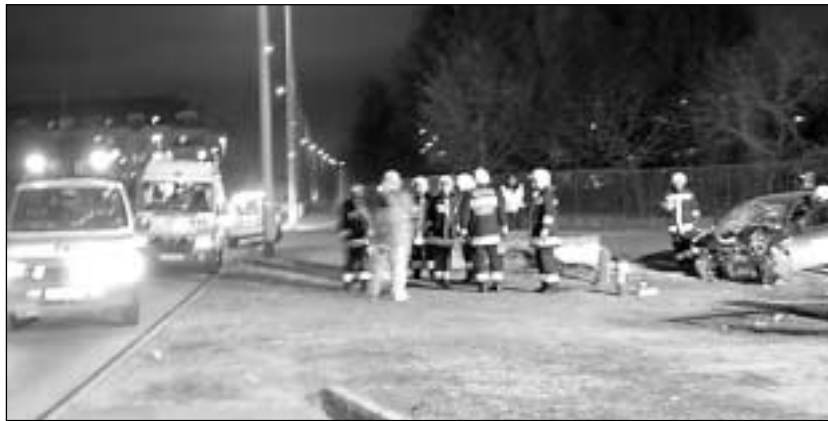
Február 18-án a Széchenyi utcában nagy sebesség mellett elvesztette uralmát autójával vezető sofőrje, és egy beton műtárgynak ütközött. Képünkön még dolgoztak a tűzoltók, a mentők és a rendőrök is

Február 5-én hajnalban egy 31 éves férfi pótkocsis teherautójával a Pesti úton haladt a Ferihegyi út irányába. A Pesti út 335. szám előtt a pótkocsi megcsúszott, és az úton keresztbe fordult. A keresztbe fordult pótkocsinak nekiütközött a Maglód irányába sza-