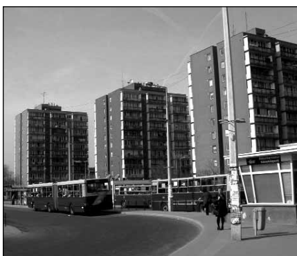
A rákoskeresztúri buszvégállomás elköltözésére vár az Elágazáson

A buszvégállomás (rákosligeti vasútvonal és a Rákos-patak közötti területre) elköltöztetésével a városközpont zaj és légszennyezettsége csökkenne, az új helyszínen pedig egy olyan közlekedési csomópont jönne létre, amely lehetőséget kínálna mind a vasúti és mind a közúti tömegközlekedésre.