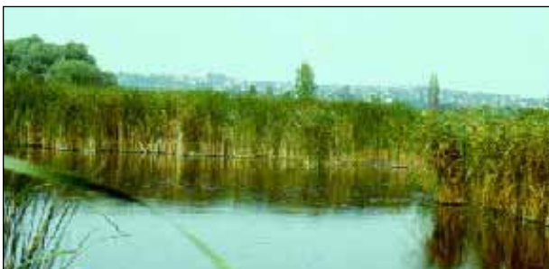
A Merzse-mocsár Budapest egyetlen mocsaras területe