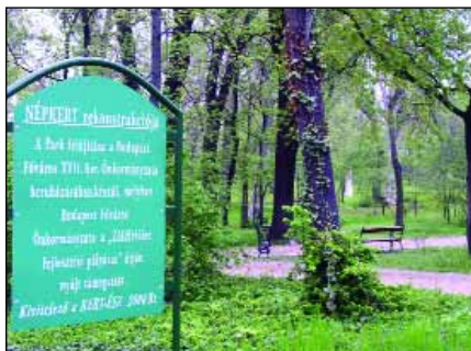
A Népkert rekonstrukciója már elkezdődött

Az egykoron a Podmaniczky-kastély kertjeként szolgáló Népkert kerületünk első számú védelem alatt álló közparkja. Elhelyezkedése ideális, mivel főközlekedési útvonal mellett található és így könnyen elérhető a lakótelepek és a kertvárosi lakórészek felől egyaránt. A fent említett tényezők valamint a park jelenleg is nagy népszerűsége indokolja a terület tudatos fejlesztését. Megfelelő pályázati lehetőség esetén a Népkert egy modern, több korosztály számára is minőségi időtöltést kínáló szabadidőközponttá alakulhat, megőrizve természeti értékeit. Az elképzelések megvalósításával a park területén zenepavilon, tekepálya és