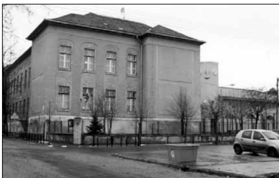
A Hősök terei iskola fejlesztése hamarosan megkezdődik

Kerületünk lakosságszámának folyamatos növekedése, valamint az oktatási feltételek és az egyes intézmények jelenlegi állapota indokolja e területen a tendenciózus rekonstrukciókat, fejlesztéseket. A fejlesztési elképzelések megvalósulása esélyt adna arra, hogy a kerület tanulói versenyképessé válhassanak a ké-