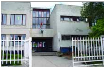
Napirenden van a Kép utcai Czimra Gyula Általános Iskola bővítése

A pályázati elképzelések realizálása esetén lehetőség nyílik a Czimra Gyula Általános Iskola rekonstrukciós tervének kivitelezésére, amely emeletráépítést, új tornatermi tömb kialakítását, valamint az ezek kivitelezéséhez szükséges átépítéseket tartalmaz. E beruházások elsődleges céljai közt a korszerű épületkialakításon túl a befogadóképesség növelése is szerepel. Ugyancsak bővítésre és átépítésre kerülne a Laborcz Ferenc Általános Iskola épülete is, amely új emeleti részeket, fedett belső udvart és új, osztott tornatermet kapna az elképzelések szerint.