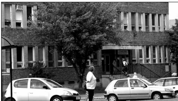
A szakrendelő bővítése elengedhetlenné vált

A folyamatos pályázatfigyelés során a polgármesteri hivatal kiemelt figyelemmel kíséri azon támogatási lehetőségeket, melyek egyrészt a különböző okokból hátrányos helyzetű egyének és csoportok segítségét, másrészt az egészségügyi szolgáltatások bővítését célozzák. Az elképzelés komplex rendszer kidolgozását tartalmazza, amely differenciáltan nyújtana segítséget a különböző okokból szociálisan hátrányos helyzetben lévő fiatalok és az idősebbek számára egyaránt. A kívánt szolgáltatási színvonal elérése képzési lehetőségek széles körű biztosításával, rekreációs munkahelyteremtéssel, a szociális intézmények bővítésével, gondozóházak létrehozásával, valamint az egyéni ellátások kidolgozott rendszerével valósulna meg. Az egészségügy területén a kiemelt jelentőségű megelőzési programok megfelelő színvonalának biztosítása, valamint az ellátás minőségének ja-