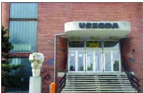
Az Újlak utcai uszoda korszerűsítése régóta esedékes

A pályázati forrásokból tervezett fejlesztési elképzelések sorában ki-