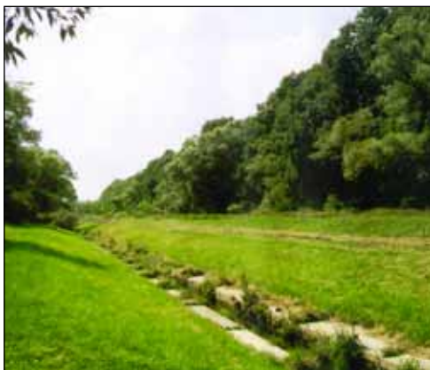
A Rákos-patak környékének rendezése is szerepel a tervek között

revitalizációja esetén – pályázati forrásokból – a patak völgye mentén egy tartalmas környezeti kikapcsolódásra alkalmas parkot lehetne létrehoz-