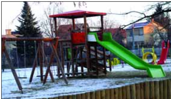
Az 525. téri játszótér már megfelel az uniós elvárásoknak

mellett, megfelelő pályázati lehetőség esetén megvalósulhat egy átfogó környezeti koncepció, mely a környezetvédelem minden területére kiterjedne a megelőzéstől kezdve a megóvason át egészen az helyreállításhig.