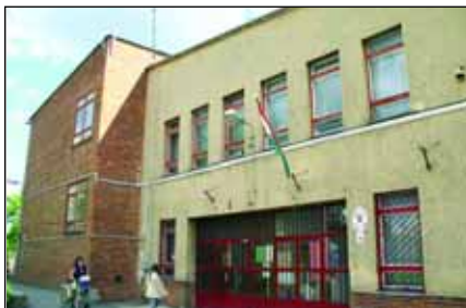
A Ferihegyi úti Laborcz Ferenc Általános Iskola fejlesztésre vár