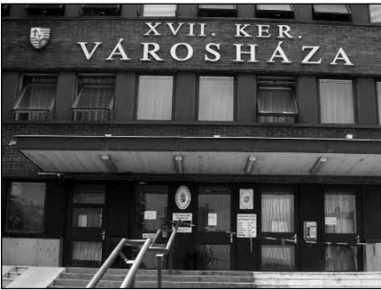
A jelenlegi polgármester hivatal épületei kinőtték a kerületet

részen mielőbb egy teljesen új, a kor igényeinek megfelelő, a jelenleginél nagyságrendekkel tágasabb ügyfélszolgálati és okmányirodát hozhasznon létre. Az új épületszárny létrejöttével növekedne az önkormányzati feladatok ellátásához szükséges közösségi tér, a dolgozói létszám és a rendelkezésre álló eszközállomány, kibővülne a nyitvatartási idő, gyorsulna az ügyintézés. E tényezők hatására az ügyfelek kiszolgálásának minősége jelentősen javulna. Az új épületszárny kialakításával lehetőség nyílna egy korszerű házasságkötő terem létrehozására is, mely ugyancsak megfelelné a kor kihívásainak. A beruházás hosszabb távon önerőből is megvalósulhat.