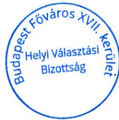
Béres Károlyné elnök

A döntés a Ve. 124. § (1) bekezdésén és 132. §-án alapul, a fellebbezési jog a Ve. 221. §, a 223-224. §-ok alapján biztosított.